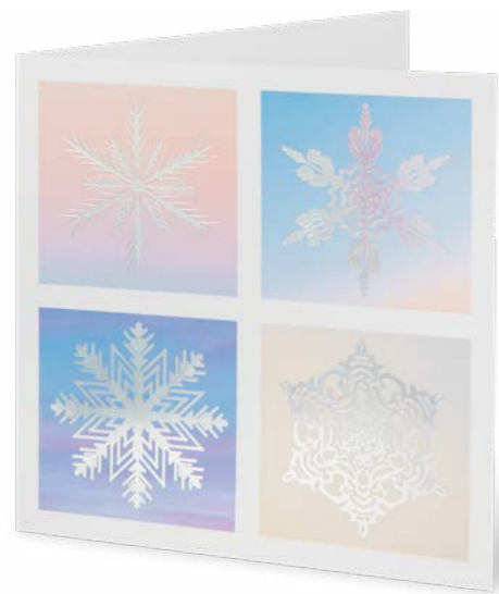
Effet holographique 16 x 16 cm No article: 20F16Q Fr. 2.80 La carte et l'enveloppe © UNICEF Suisse/Liechtenstein