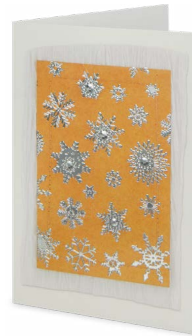
Argent à chaud 11,7 x 17,3 cm No article: 20F10B Fr. 2.50 La carte et l'enveloppe © UNICEF Suisse/Liechtenstein, Werkatelier Basel, Suisse