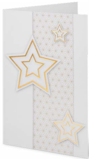
Papier structuré, or à chaud 11,7 x 17,3 cm No article: 20F09B Fr. 2.70 La carte et l'enveloppe © UNICEF Suisse/Liechtenstein