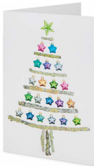
Papier mat, avec effet holographique 11,7 x 17,3 cm No article: 20F07B Fr. 2.70 La carte et l'enveloppe © UNICEF Suisse/Liechtenstein, © mauritius images/Westend61