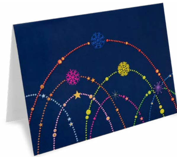
Or à chaud 21 x 14,8 cm No article: 20F14P Fr. 2.80 La carte et l'enveloppe © UNICEF Suisse/Liechtenstein, Amadeus Bachmayr, Allemagne