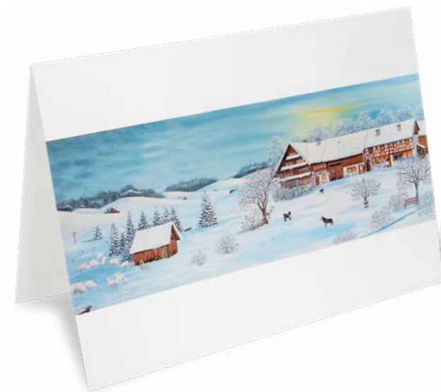
Papier brillant 21 x 14,8 cm No article: 20F22P Fr. 2.80 La carte et l'enveloppe © Ursula Stadler-Lanker, Suisse