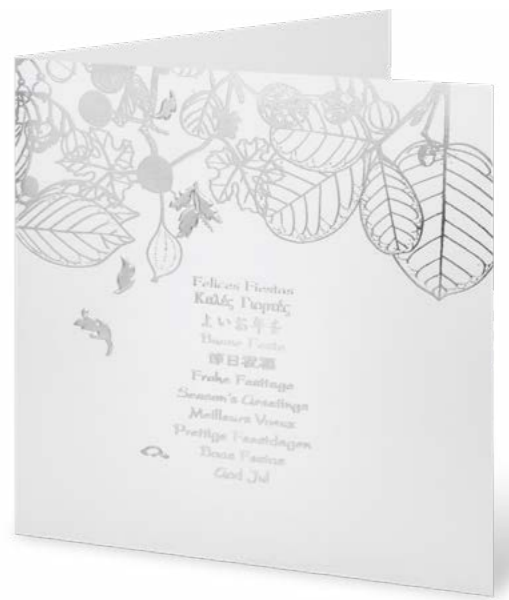
Papier mat, argent à chaud, gaufré 16 x 16 cm No article: 20F05Q Fr. 2.90 La carte et l'enveloppe © UNICEF Studio