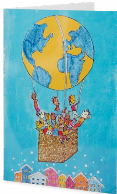
Papier brillant 14,8 x 21 cm No article: 20F06P Fr. 2.80 La carte et l'enveloppe © Margrit Kammermann, Suisse