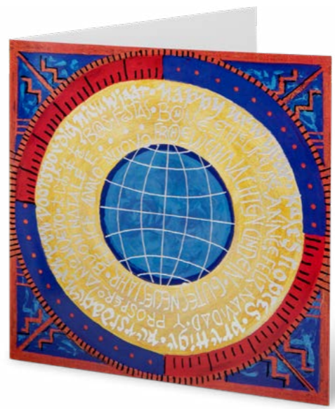
Argent à chaud 16 x 16 cm No article: 20F03Q Fr. 2.80 La carte et l'enveloppe © UNICEF Suisse/Liechtenstein, Sabira Manek, Grande-Bretagne