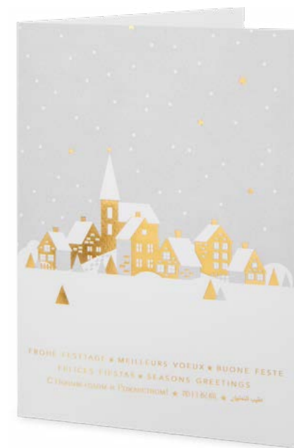
Papier structuré, or à chaud 14,8 x 21 cm No article: 20F20P Fr. 2.90 La carte et l'enveloppe © UNICEF Suisse/Liechtenstein, Belarto, Pays-Bas