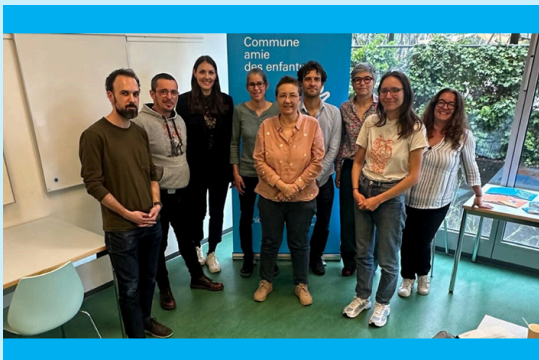
Table ronde «Communes amies des enfants» de Suisse romande

La deuxième table ronde organisée par l'UNICEF Suisse et Liechtenstein à l'attention des Communes amies des enfants de Suisse romande s'est tenue le 7 mai. L'occasion pour les communes labellisées et en cours de labellisation de renforcer leurs liens et partager leurs expériences.