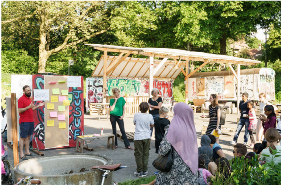
Lors de l'événement final, les jeunes reporters transmettent leurs souhaits et idées à Fuat Köçer.