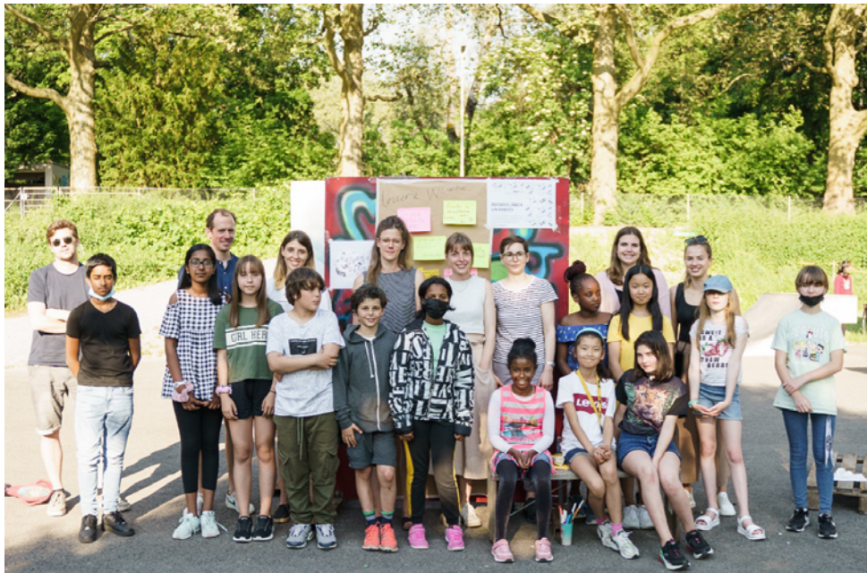
Événement final juin 2021 – les reporters avec leurs mentors (groupe incomplet)