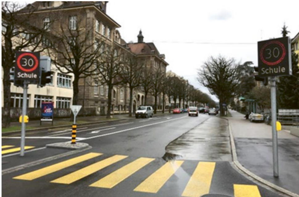
fig. 1: Signaux LED à messages variables à la bifurcation de la Burgfelderstrasse