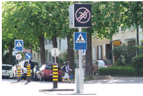
fig. 3: Fin de la zone temporaire limitée à 30