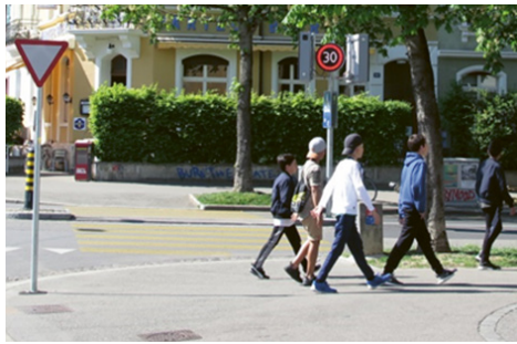
fig. 2: Bifurcation de la Hegenheimerstrasse