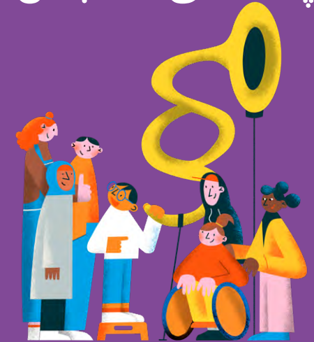
اطلاعاتی برای کودکان و نوجوانان

در این بروشور به این پرسش‌ها پاسخ می‌دهیم: